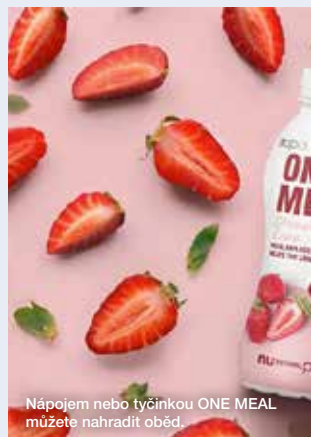
Nápojem nebo tyčinkou ONE MEAL můžete nahradit oběd.