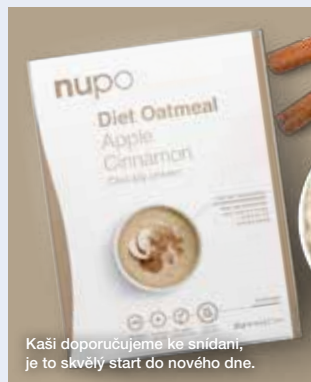
Kaši doporučujeme ke snídani, je to skvělý start do nového dne.